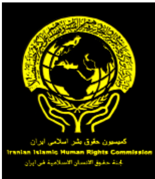
کمیسیون حقوق بشر اسلامی ایران