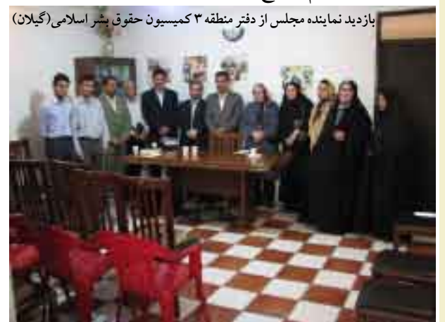
بازدید نماینده مجلس از دفتر منطقه ۳ کمیسیون حقوق بشر اسلامی (گیلان)

- برخی از دفاتر در ماه گذشته برای اجرای برنامه های خود متونی که بین مردم توزیع شده را تهیه کردند که از جمله می