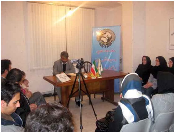
نشست انقلاب اسلامی، تعزیرات حکومتی و حقوق شهروندی - تبریز

حمایت از حقوق زندانیان دفتر منطقه با زندانیان سیاسی قبل از انقلاب، برگزاری نشست علمی انقلاب اسلامی و توسعه قضائی، برگزاری نشست علمی انقلاب اسلامی و نقش آن در احیای حقوق اقدام و اقلیت‌های دینی، برگزاری نشست انقلاب اسلامی و نقش آن در آزادی مطبوعات و رسانه‌ها، تهیه و ارسال بیانیه جمعی از همیاران حقوق بشر مرتبط با دفتر منطقه در خصوص اقدام پلیس جمهوری آذربایجان در حمله به شیعیان عزادار، برگزاری نشست بررسی قیام ۲۹ بهمن تبریز قبل از انقلاب اسلامی و تأثیر آن بر حقوق ملت ایران، برگزاری نشست سازمان تعزیرات حکومتی و نقش آن در رعایت حقوق شهروندی، برگزاری نشست نقش انقلاب اسلامی در دادرسی عادلانه، برگزاری نشست انقلاب اسلامی و نقش آن در احیای بخش کشاورزی و محیط زیست سالم، دیدار اعضای کارگروه حقوق زنان دفتر با امام جمعه مرکز استان.