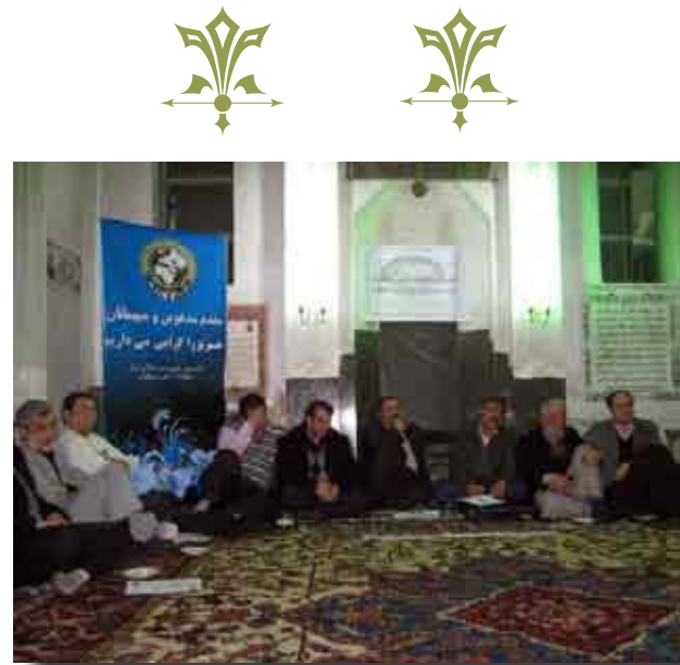
نشست «انقلاب اسلامی، حقوق زندانی و زندانی سیاسی» - تبریز