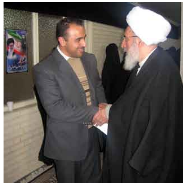
دیدار با حضرت آیت الله محسن مجتهد شبستری - تبریز