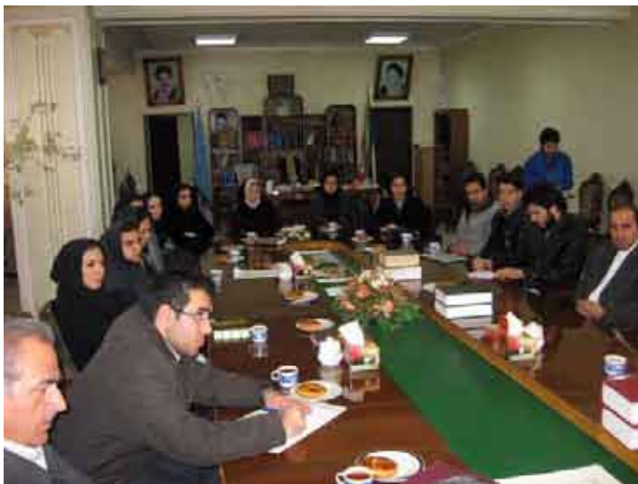
نشست انقلاب اسلامی و توسعه قضایی - تبریز